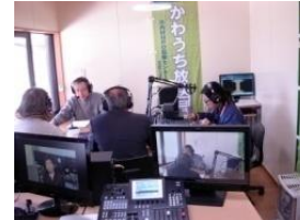
かわうち放送局 災害放送局 インターネット放送局