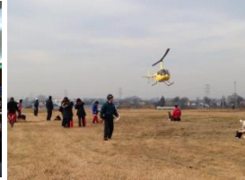
協働型災害訓練(実訓練)