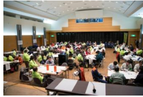
協働型災害訓練(図上訓練)